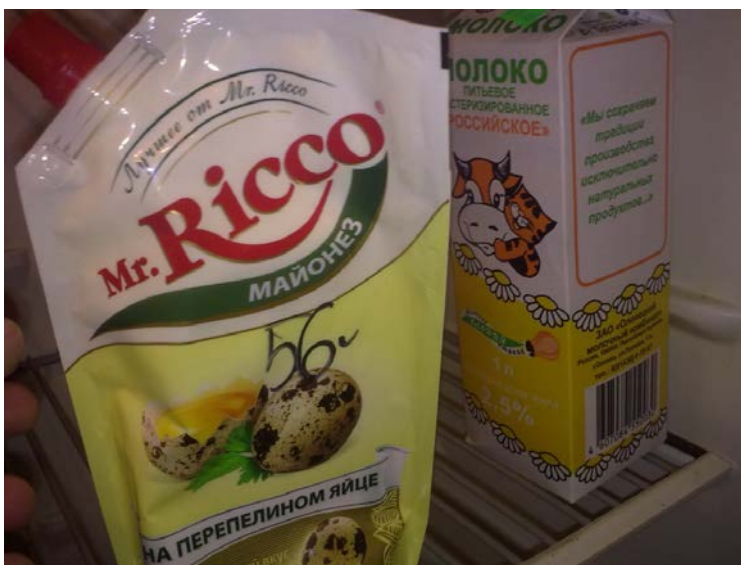
(kuvassa majoneesi ja maitopurkki)

Päivät menivät töissä, ja illat harrastaessa jääkiekkoa. Venäjällä jääkiekko on hyvin suosittu laji jo Neuvostoliiton ajoilta, ja tietenkkin pienessä tuppukylässäkin oli kaukalo tehtynä paikalliselle fudis kentälle. Työt olivat 6-8 tunnin päiviä, ja niissä oli 2 taukoa, kummatkin noin 30 minuuttia per 3 tuntia. Tässä välissä yleensä annettiin raportti mitä on tehty, ja syötiin mukaan otetut eväät. Hinnat venäjällä eivät ole kummoisemat, maito maksoi noin 60 senttiä litralta ja leipäpaketti toiset 70 senttiä. Tietenkkin kaikki ulkomailta saadut tuotteet kuten esimerkiksi oltermanni juusto, maksoi 15 euroa puolen kilon paketilta, mutta se on normaalia kun tietää että maa oli Neuvostoliiton ajoilta hyvin suljettu yhteiskunta.